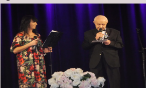
Koncert Niepodległościowy 17 III w DK Świt. Owacje na stojąco.