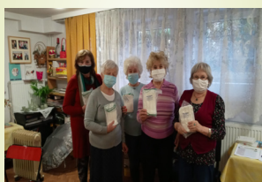
Z FLORYNA otrzymaliśmy maseczki ochronne.