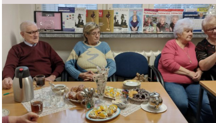
Dzień Kobiet w Kole nr 15

Sekretarz, Skarbnik, Przewodnicząca ZG http://pzerii.org/