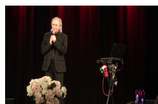
To kilka migawek z koncertu POWITANIE WIOSNY 17 III 2022 r. w DK Świt