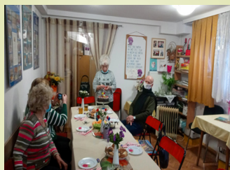
rokiem nam młodnieje.