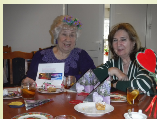
Poranek Koła nr 2 w Jowiszu