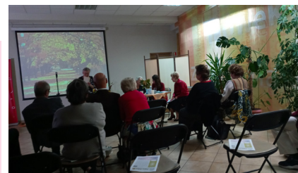
Występ Grupy poetyckiej AKANT